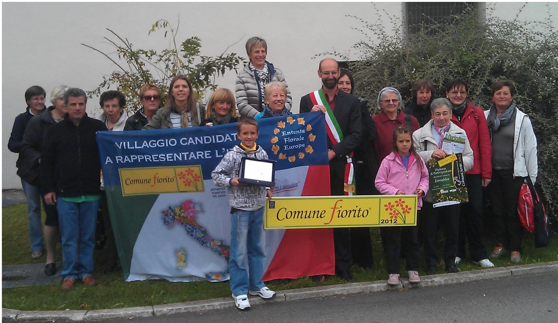
○ Transacqua, 14 ottobre 2012