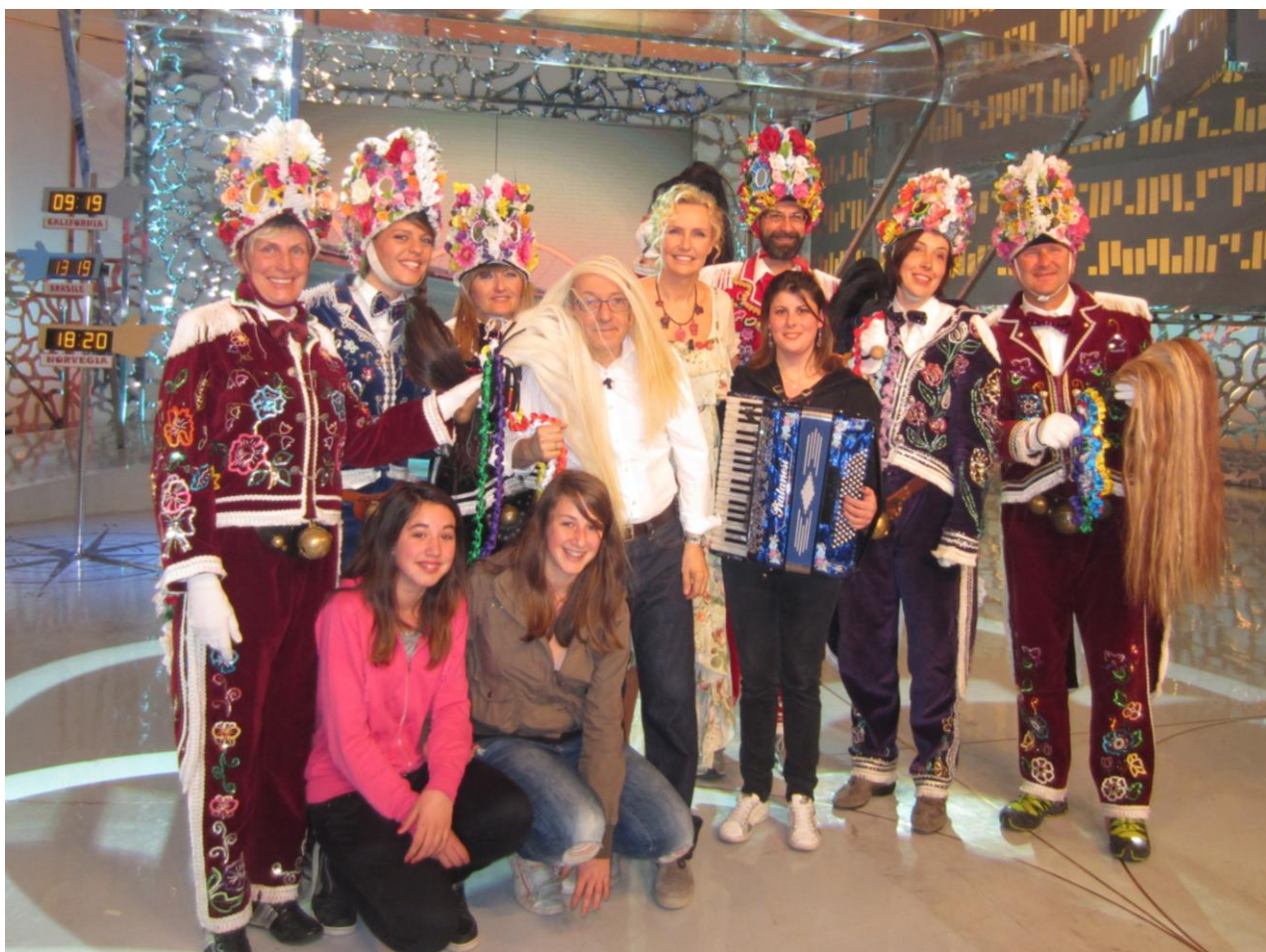
La Banda di Mascre con Licia Colò e Dario Vergassola.

Il nostro Comune inizia ad apparire nelle proposte di alcuni siti di Agenzie di Viaggio che organizzano delle giornate alla scoperta del nostro territorio e delle sue attrattive (Museo a cielo aperto, museo dell'energia, museo della latteria, trésor de la paroisse). Sono pervenute inoltre diverse richieste per poter organizzare quest'estate alcuni stages musicali ad Etroubles e sono tantissimi i gruppi di scout che ci stanno contattando per poter soggiornare da noi.